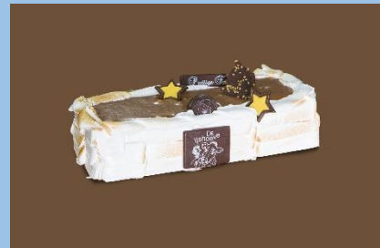
Buche: vanaf 4 tot 10 personen

Smaken ijs te verkrijgen: vanille, mokka, speculoos, stracciatella, aardbei, praline, banaan en chocolade