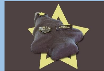
Kerstboom: 5 personen