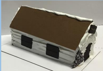
Huisje: vanaf 8 personen