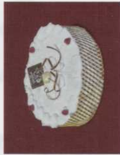
Ronde: - met chocoladeband - vanaf 4 tot 14 pers.