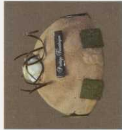
Bombe: - met coulis of chocoladespiegel - vanaf 6 tot 12 pers.