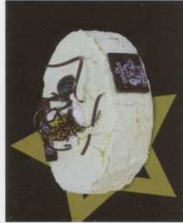
Ronde: - met chocoladeband en advocaat - met hostie papier - vanaf 4 tot 14 pers-