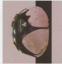
Bombe: - met coulis of chocoladespiegel of gele ganache - vanaf 6 tot 14 pers.