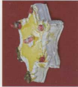
Kerstster: - met gele ganache - vanaf 6 tot 12 pers