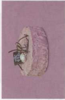
Boomstam: - vanaf 4 tot 8 pers.