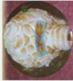
Iglo: - vanaf 6 tot 12 pers.