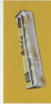
Buche: - met chocoladespiegel of gele ganache - vanaf 4 tot 10 pers.