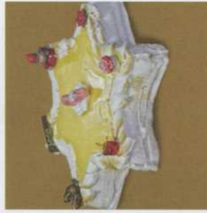
Ster: - met gele ganache of meringue - vanaf 6 tot 12 pers.