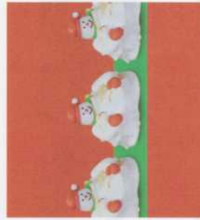
Sneeuwmantetje 3,70 euro/stuk