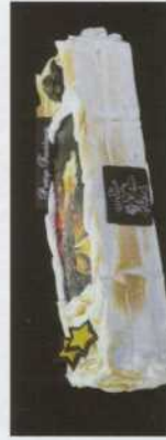
Buche: - met chocoladespiegel en chocolade ijs - gele ganache of meringue - coulis - met foto in hostie - vanaf 4 tot 10 pers.